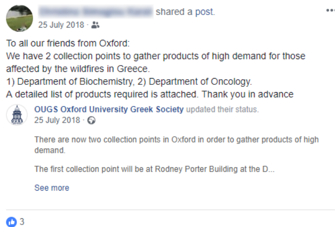
Εικόνα 4. Αναδημοσίευση στο Facebook για εθελοντικές δράσεις στην Οξφόρδη για τη στήριξη των πυρόπληκτων στο Μάτι